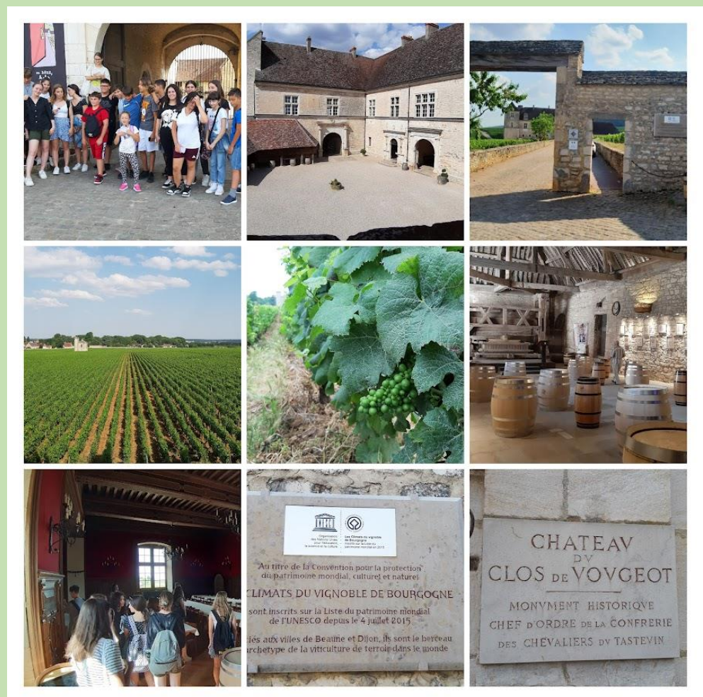
GRAD CLOS DE VOUGEOT