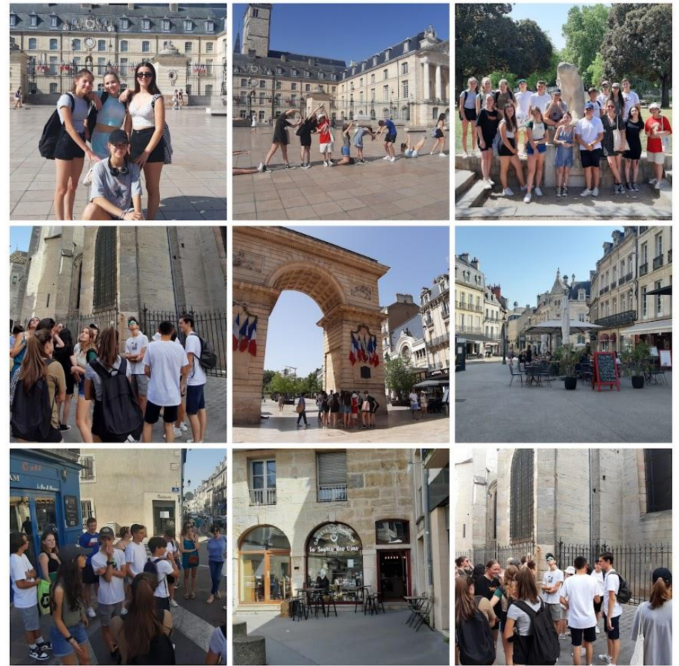
POTEPANJE PO DIJONU