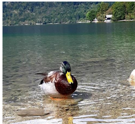
Kristalno čista voda privabi mnoge živali.