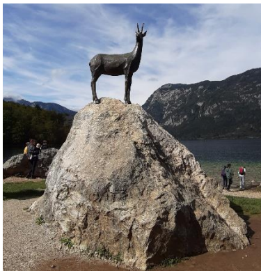
Kozorog ob Bohinjskem jezeru

Do Vogla smo se peljali z gondolo in (ker je bila sedežnica zaprta) smo šli kar peš do zvona oz. križa Orlove glave. Na poti do križa so se nam pridružile tudi divje koze.