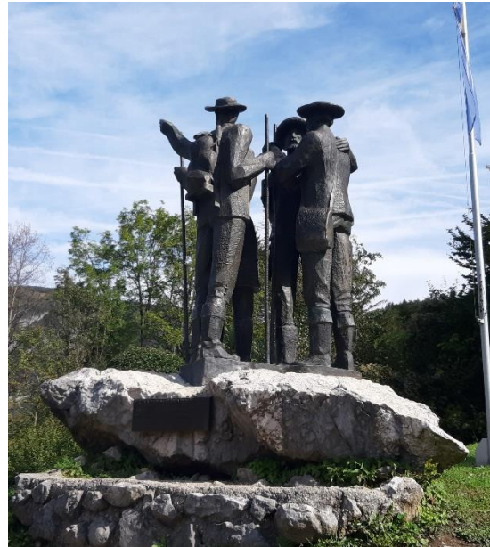
Kip štirih mož

Do Vogla smo se peljali z gondolo in (ker je bila sedežnica zaprta) smo šli kar peš do zvona oz. križa Orlove glave. Na poti do križa so se nam pridružile tudi divje koze.